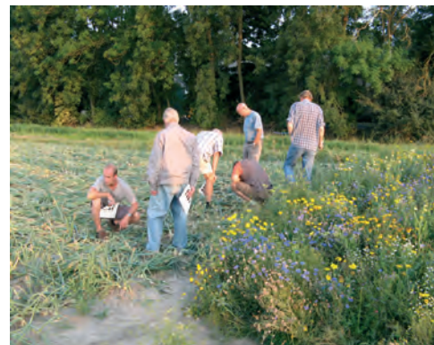
Akkerrand in volle bloei

Het project wordt in het kader van het INTERREG IV A-programma Deutschland-Nederland gefinancierd met middelen uit het Europese Fonds voor Regionale Ontwikkeling (EFRO), de provincie Brabant, de provincie Gelderland, de provincie Limburg, het Ministerium für Wirtschaft, Energie, Bauen, Wohnen und Verkehr van de deelstaat Nordrhein-Westfalen en de HIT Umwelt- und Naturschutz Stiftungs-GmbH. Het project wordt begeleid door het programma management van de Euregio Rijn-Waal en de Euregio Rijn-Maas-Noord. Samenwerkende projectpartners zijn de Nederlandse waterschappen Aa en Maas, Rivierenland en Peel en Maasvallei en de Duitse waterschappen Schwalmverband en Niersverband. Dit internationale project heeft een looptijd tot en met 2012. Aanvullende informatie via de internetsite www.nagrewa.eu .