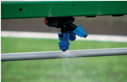
Een goed afgestelde spuitdop

U wordt als akkerbouwer, loonwerker of veehouder in het Gelders deel van het beheersgebied van Waterschap Rivierenland uitgenodigd om deel te nemen aan het project 'Natuurlijke grenswateren' (Nagrewa). Hiermee levert u een bijdrage aan schoner oppervlaktewater en meer biodiversiteit. Winst is ook te behalen voor uw bedrijfsvoering. Wij bieden u demonstratie- en studiegroepbijeenkomsten over nieuwe technieken bij gewasbescherming, bodembeheer en natuurlijke plaagbestrijding door middel van akkerranden.